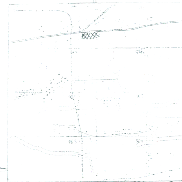
SZKIC ORIENTACYJNY SKALA 1:25 000

Zal. Nr A... do Uchwały Nr 169/XIX/2000 Rady Gminy w Radzanowie z dnia 29.08.2000 r.